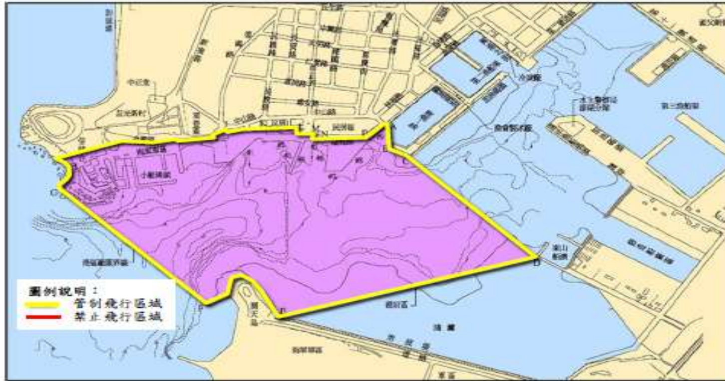
澎湖港(馬公碼頭區)