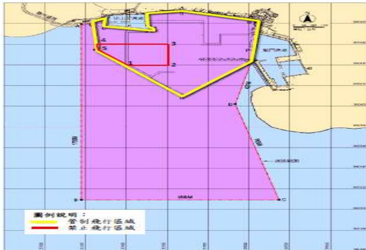
澎湖港(龍門尖山碼頭區)