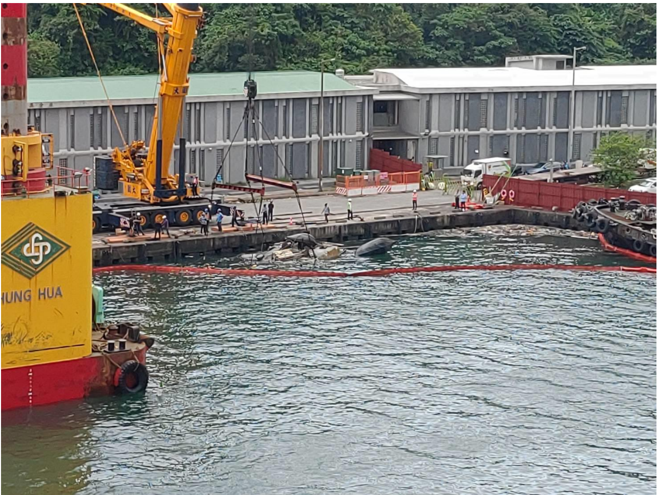
圖 1. 新臺勝 33 號浮揚進行吊起