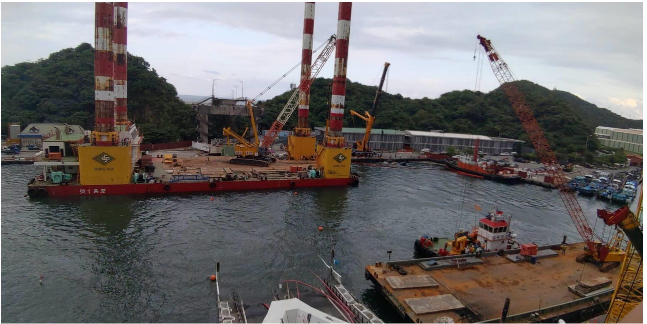
圖 3. 宏禹 1 號靠泊於漁具倉庫前作業