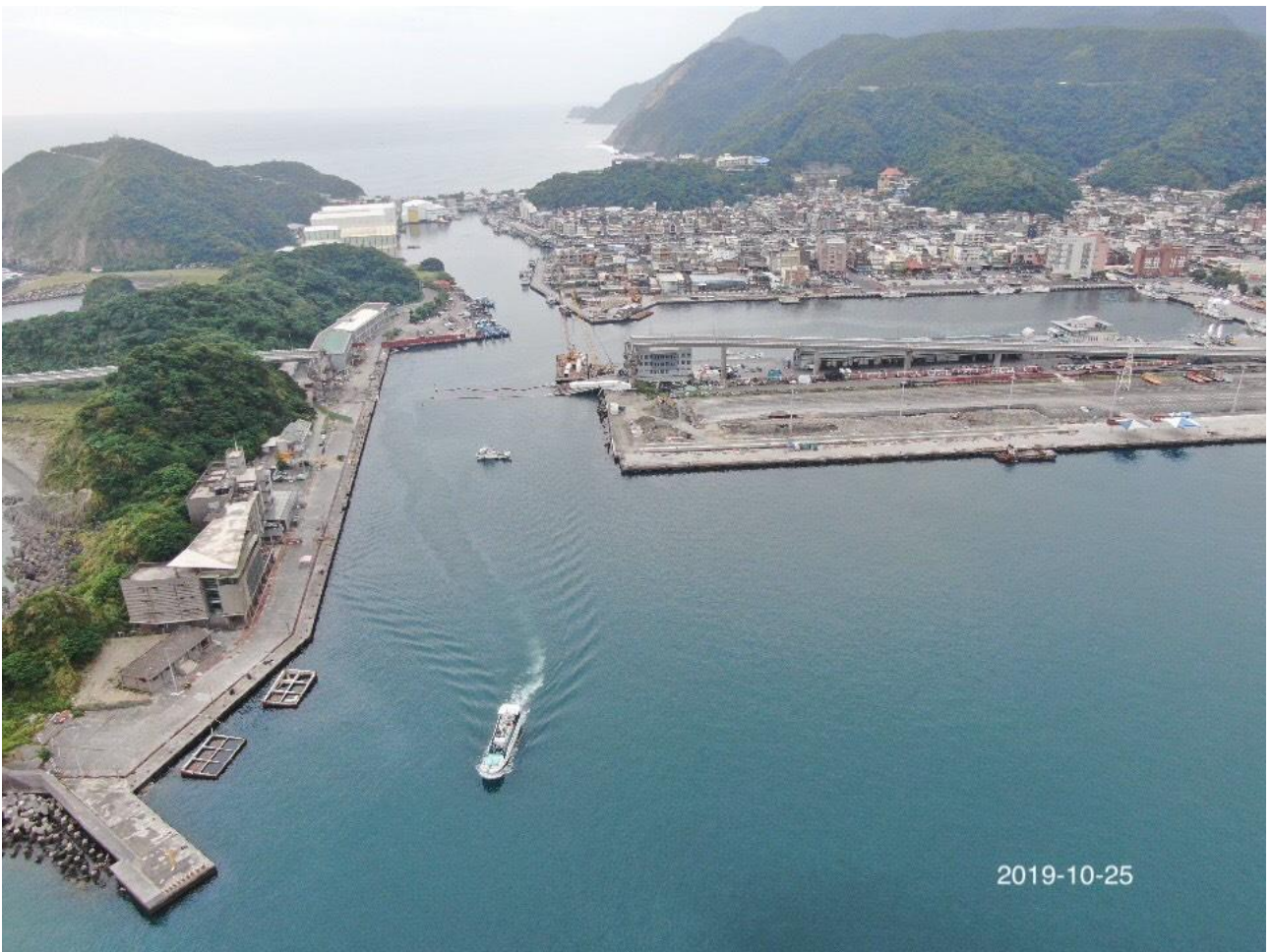
圖 1. 南方澳漁港 20 米新臨時航道開放航行