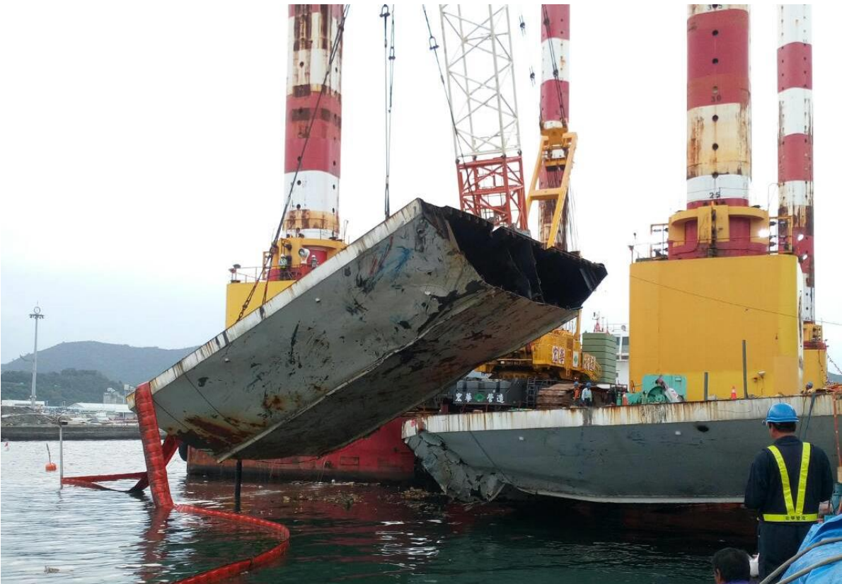
圖 2: 南方澳跨港大橋第一塊橋面版吊離情況