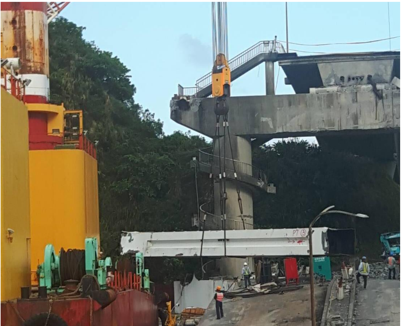
圖 1: 今日下午 3 時順利吊起 68 噸之鋼樑