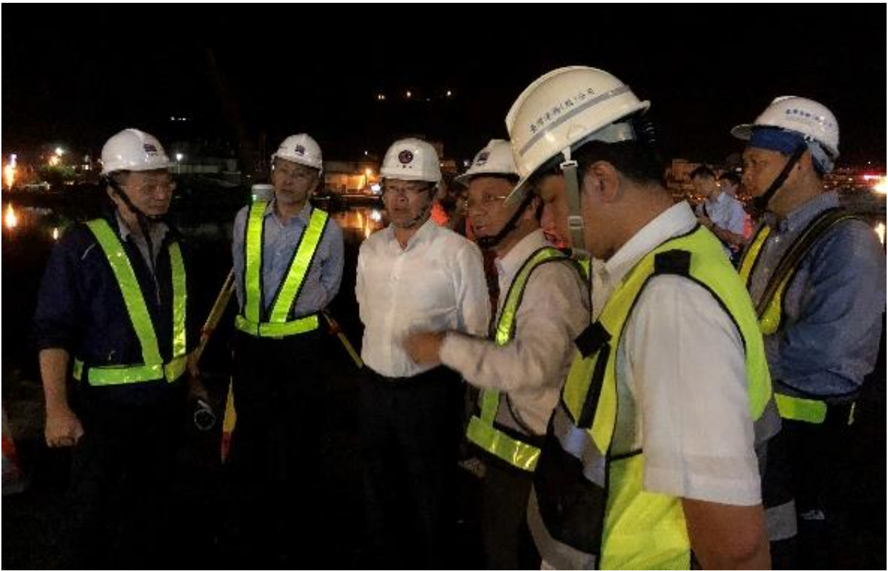
圖 1 :左一為港務公司工程處鄭資深副處長智文；左二為港務公司陳總經理紹良；左三為交通部黃政務次長玉霖兼代港務公司董事長；左四為港務公司基隆分公司沈副總工程司光青