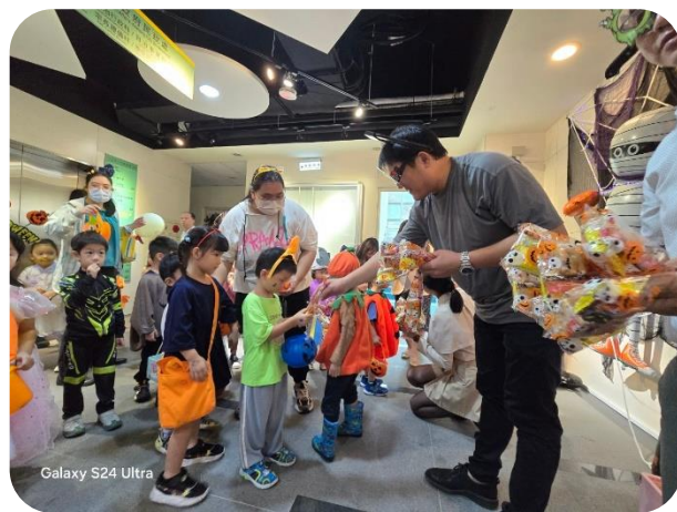
Galaxy S24 Ultra