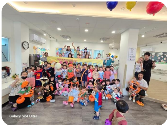
Galaxy S24 Ultra

雪花隨風飄，花鹿在奔跑，聖誕老公公，駕著美麗雪橇...，一 年一度聖誕佳節來臨，聖誕老公公到教保中心來發禮物嚕~ 期許每位孩子身體健康、平安長大。