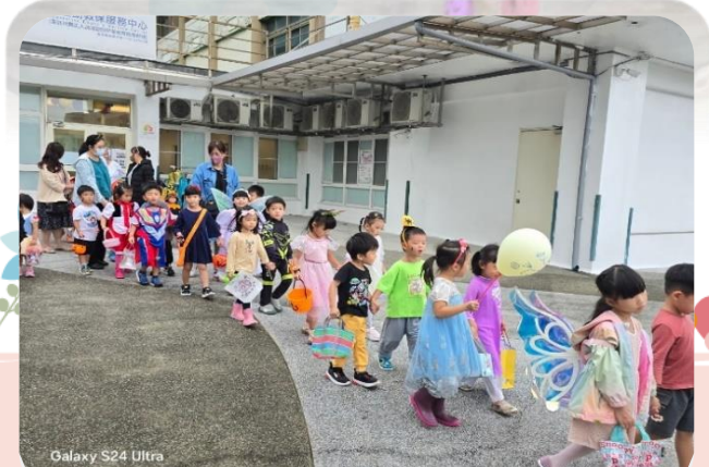
Galaxy S24 Ultra