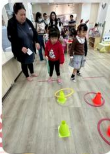
歡樂聖誕派對~挑戰關卡活動，歡迎聖誕老公公到來