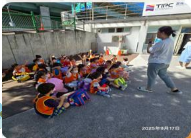
防震三步驟~ 趴下、掩護、穩住