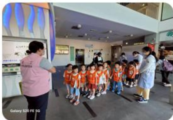
參訪圖書館，並體驗小小圖書館園一員