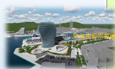
A1-基隆港 旅運複合商業大樓