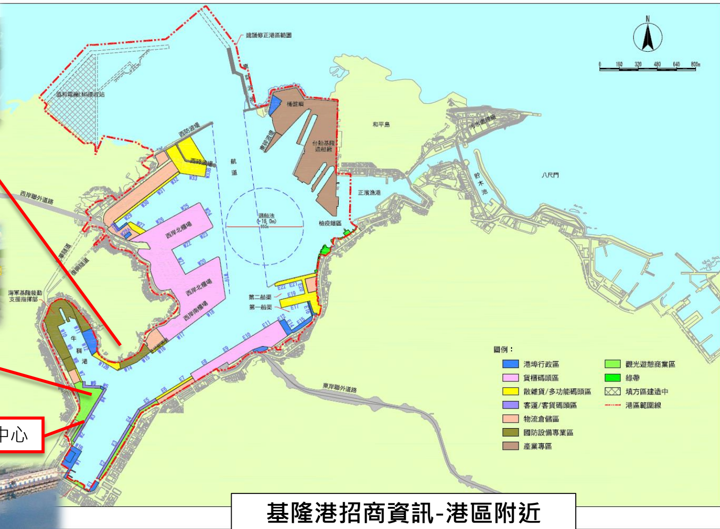
A2-西2-西3郵輪旅運中心